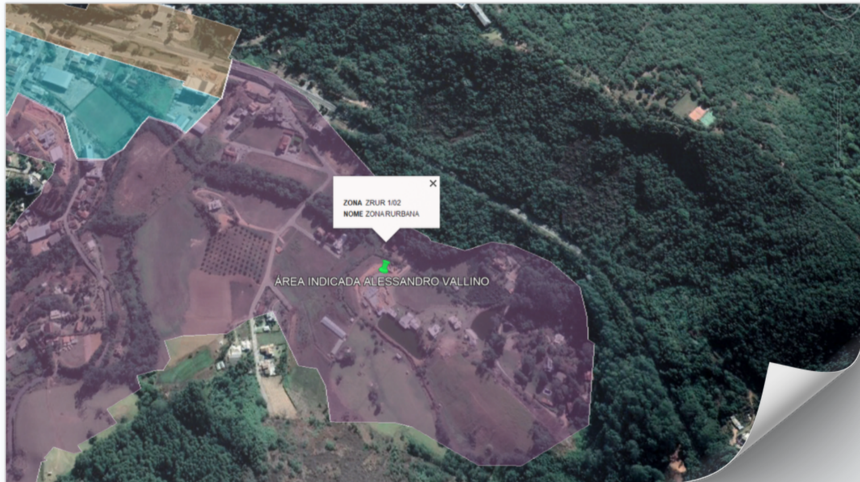
IMAGEM DO TERRENO.

A IMPLANTAÇÃO DE TAIS ATIVIDADES DO GRUPO 01 É PROIBIDA, CONFORME ESTABELECE O ANEXO 5 DO PLANO DIRETOR MUNICIPAL. NO ENTANTO, CONSIDERANDO A ÁREA DO EMPREENDIMENTO INFORMADA NO SIMPLIFICA ES DE 400,28M 2 , AS ATIVIDADES PASSAM A SER CONSIDERADAS DO GRUPO 02 (APENAS NO QUE DIZ RESPEITO AOS USOS PERMITIDOS E TOLERADOS POR ZONA), DE ACORDO COM O §1º DO ARTIGO 68 DO PLANO DIRETOR MUNICIPAL. SENDO ASSIM, EM CONFORMIDADE COM O ANEXO 5 DO PDM, AS ATIVIDADES DO GRUPO 02 SÃO CLASSIFICADAS COMO TOLERADAS E A SUA IMPLANTAÇÃO SÓ PODE SER FEITA A PARTIR DA AVALIAÇÃO DO CONSELHO DO PLANO DIRETOR MUNICIPAL (DE ACORDO COM O ARTIGO 73 DO PDM).